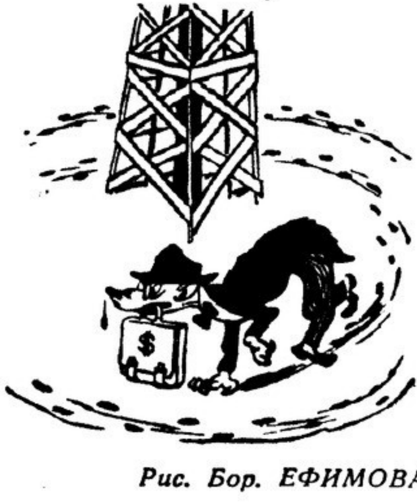
Рис. Бор. ЕФИМОВА

Визит Гувера-младшего в Иран предшествовала продолжительная и тщательная подготовка. Как известно, реакционная печать США цинично приветствовала переворот в Иране и свержение правительства Мосаддига, открыто заявляя, что теперь создана «почва» для «урегулирования» нефтяного вопроса в духе, желательном Вашингтону. Заочная печать немедленно стала требовать, чтобы «почва» в Иране была «уничтожена долларами» в обмен на определенные политические обязательства Ирана перед Вашингтоном и прежде всего в отношении нефтяной проблемы.